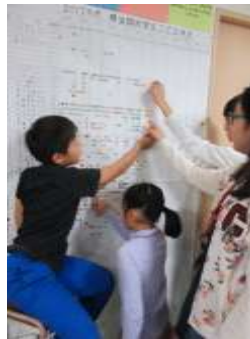
みな自分の所に シールを貼ります。

毎月第一主日に誕生会を行つていま すが、月別の誕生一覧表も掲げ、子供たち の顔を思い浮かべながら確認していま す。JCは、礼拝と分級あわせて1時間ほど ですが、子供達との交わりを大切にし ていきたいと願っています。